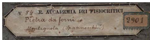
Pietra da forni con relativa etichetta preesistente sul supporto

Altri casi riguardano la sostituzione della originaria nomenclatura con quella attualmente accreditata (per es. ematite al posto di ferro oligisto )